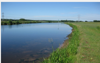
Helyzetkép a következő év nyarán