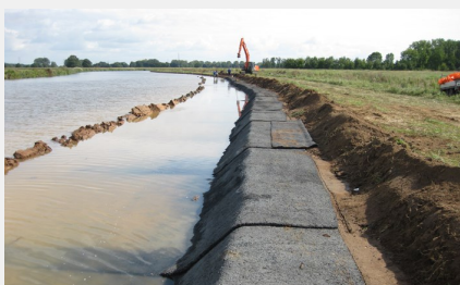
Helyzetkép telepítés után