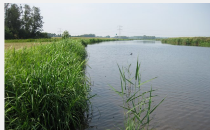
Sűrű növényzetű part két éven belül

Az Enkammat A20 erózióvédő matrac telepítése előtt a folyó partfalait újraprofilozták és egyfajta sekély ártérrel, padkával látták el. A fűmagon túl nád-gyöktörzseket is vetettek a padkarészbe, hogy idővel egy sűrű nádas keletkezhesen.