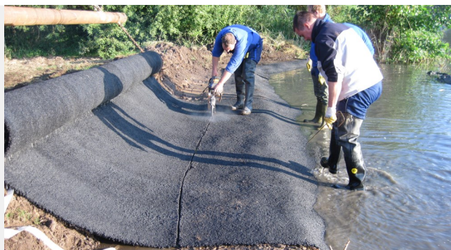
A méretre vágás a helyszínen könnyen elvégezhető